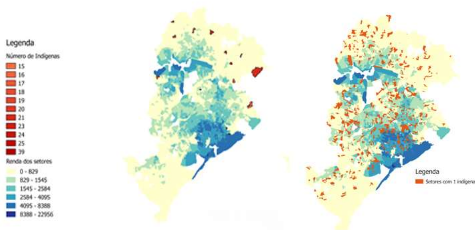
FIGURA 2 - Número de indígenas residentes e rendimento médio mensal dos setores censitários – Belo Horizonte - 2010