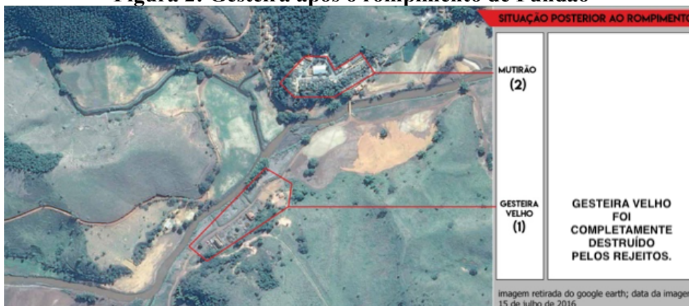
Figura 2: Gesteira após o rompimento de Fundão