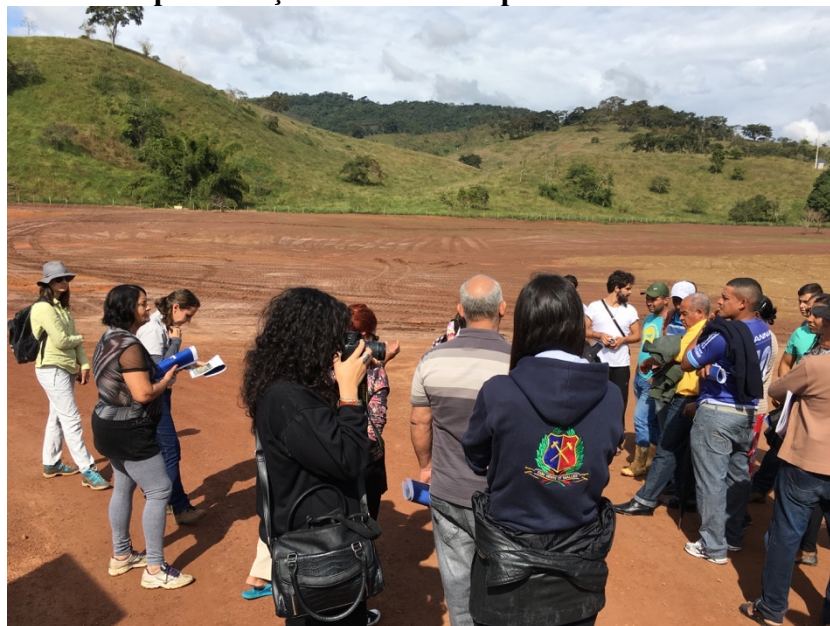
Figura 4: Visita de apresentação dos terrenos para o reassentamento de Gesteira