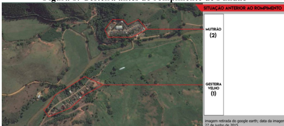
Figura 1: Gesteira antes do rompimento de Fundão