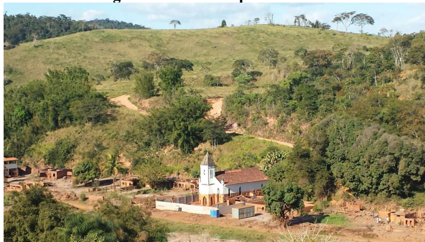
Figura 3: Gesteira após o desastre

A Fundação Renova, como já mencionado, foi instituída como responsável pela condução de tais reparações e, por isso, tem cabido a ela tratar do reassentamento coletivo de Gesteira. Entretanto, no momento em que começamos, como grupo de pesquisa – GEPSA/UFOP – a acompanhar e trabalhar, com as pessoas atingidas, acerca das questões afetas ao reassentamento, a Renova ainda não havia sido implementada – suas atividades tiveram início em agosto de 2016. Naquele momento, era ainda a Samarco e suas terceirizadas quem encaminhavam e implementavam ações nos territórios afetados (Figura 3).